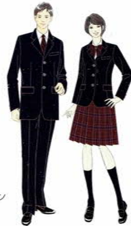
・新制服採用デザインイメージ画です