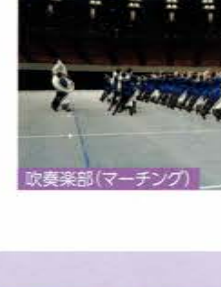
吹奏楽部(マーチング)