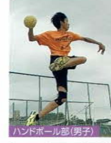
ハンドボール部(男子)