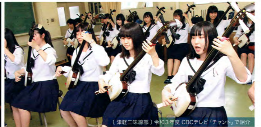
(津軽三味線部) 令和3年度 CBCテレビ「チャント」で紹介