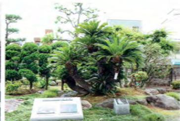
戦災で唯一焼け残った蘇鉄