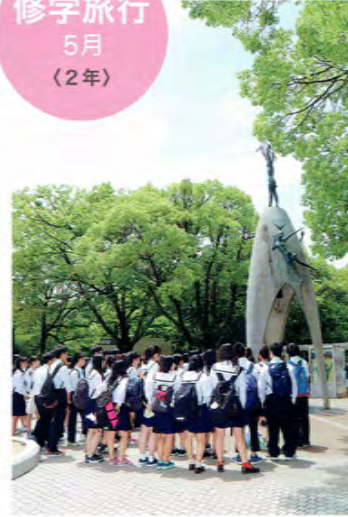
広島(平和学習)、岡山、四国方面に2泊3日で行います。