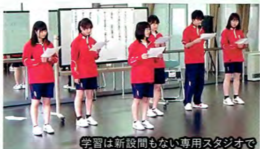
学習は新設間もない専用スタジオで

様々なソフトウェアを用いた表現方法を学び、多様な作品作りに挑みます。思考錯誤を重ねることで、表現したいものが本当に表現できているかを見極める力も育てます。