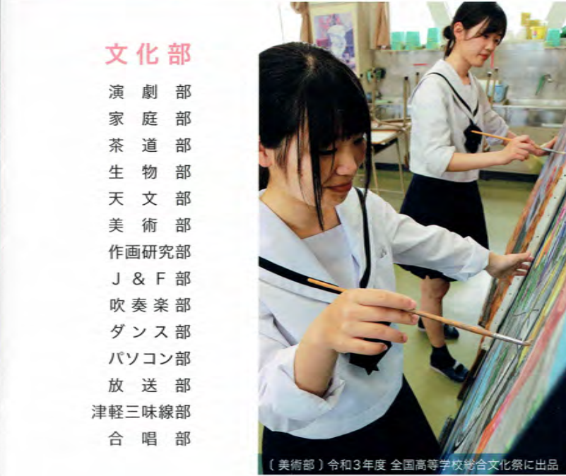
(美術部) 令和3年度 全国高等学校総合文化祭に出品