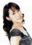
まほろば 遊さん ダンス表現Ⅰ・Ⅱ

最初からデキル人なんていません。私も中高生の時は人から質問されても、親がかわりに答えるような子供でした。簡単そうで難しい「自己表現」は、人に伝わる声の出し方と活舌を学ぶ事で自由に表現できるようになります。また、ボイストレーニングの中の呼吸法は、歌・ダンス・演技の全てにおいての基礎となります。歌って、踊って芝居ができる…宝塚歌劇団では当たり前ですが、今やその波は声優・歌手・モデル業界にまで及んでいます。芸能の世界を目指す方には勿論、目指さない方にも、この創造表現コースで、明るくポジティブな精神、姿勢、よく伝わる声、表現方法を学べば、社会人になっても、接客・営業の場などで大変役に立ちます。100年以上も人々を魅了してやまない宝塚歌劇団で培った経験を生かし、皆さんの個性がより輝くように引き出し、漠然としていた夢が将来に繋がる夢へと考えていけるようになっていく創造表現コースです。