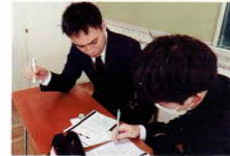
一人ひとりに面談し、一緒に進路を考えてくれる先生たち