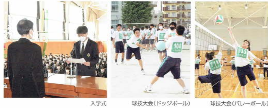
入学式 球技大会(ドッジボール) 球技大会(バレーボール)