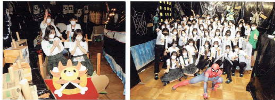
文化祭(教室発表) 文化祭(教室発表)