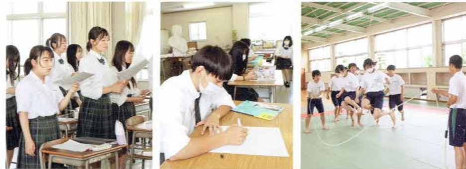
授業風景(音楽) 授業風景(美術) 授業風景(体育)