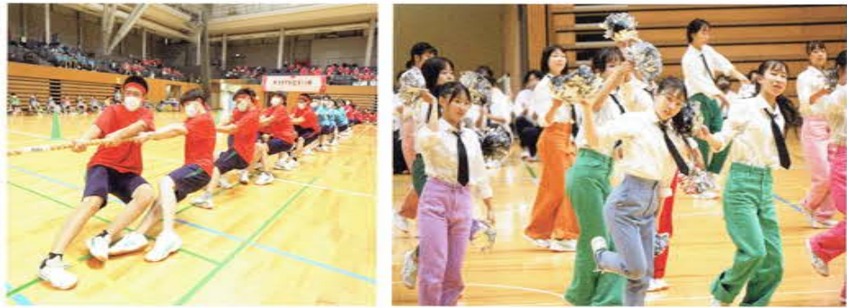
体育祭(群団種目) 体育祭(パフォーマンス発表)