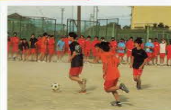
#Ball Game Festival