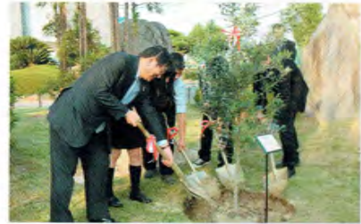
日本・イスラエル国交樹立60周年記念植樹

あなたの夢を瑞陵のキャンパスで広げてみてください。自分の可能性を信じる。すべてはそこから始まります。一緒に新しい世紀をつくりませんか。