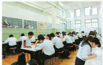
感喜堂学習スペース

：富士山の歴史と宗教について学びました。題材は、自然科学から作家のエッセイと幅広く、時に英語の音声を取り返し聞きながら、教科書の理解を深めます。