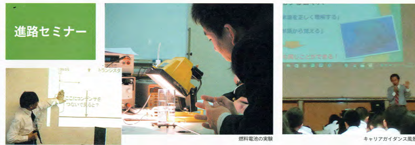
講演風景:手で触れる微分積分 燃料電池の実験 キャリアガイダンス風景

各方面で活躍している研究者や職業人を迎えての生徒向けセミナーを授業後に行っています。瑞陵の卒業生にもご協力をいただいています。職業に関するものと学問に関するものがあり、毎年、数回が計画実施されています。自分の興味があるものに自由に参加できます。またHRの時間にはキャリアガイダンス、職業人講演会、大学教授による模擬授業も開催しています。仕事や大学講義内容を理解し、進路選択に非常に役立っています。