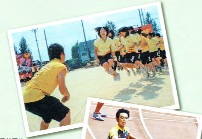
センボ・スギハラ・メモリアル