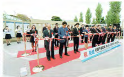
杉原千畝顕彰施設 センボ・スギハラ・メモリアル