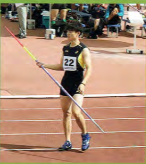
国民体育大会(茨城県)