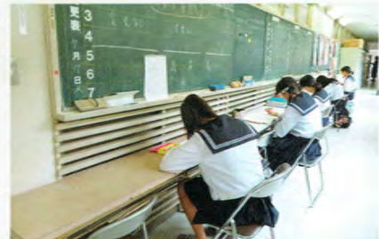
職員室前学習スペース

：創立110周年記念事業の一環として、同窓会がエアコンを設置し、学習スペースへと整備。生徒に開放しています。