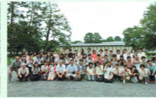
幕末の京都(京都御所)