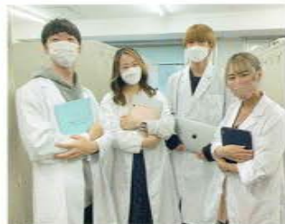
実習前にロッカー室で (左から2人目)