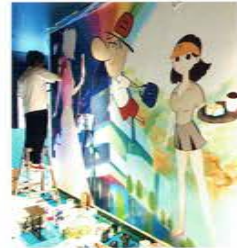
渋谷パルコの地下に壁画を描き中