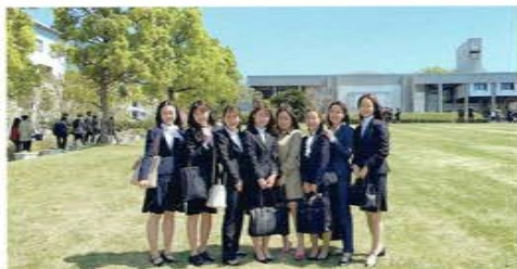
入学式の様子。コロナの影響で1年生の時は開催されず、2年生の4月に東山キャンパスで行われました。