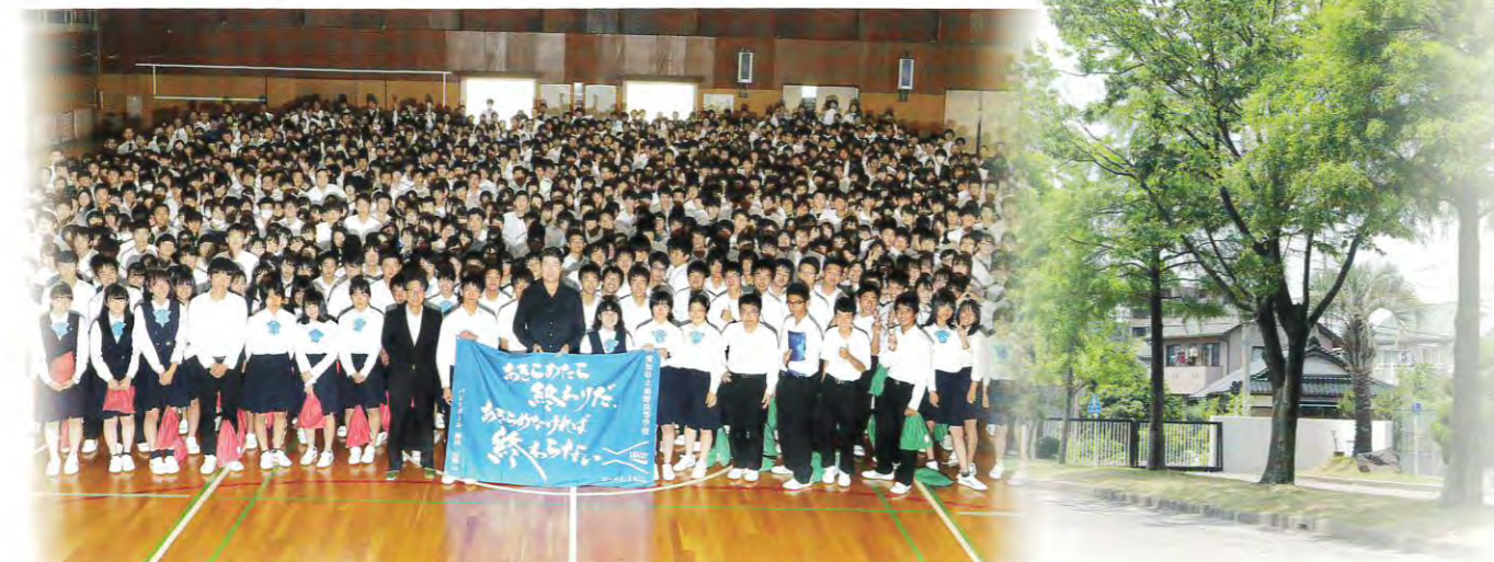
創立50周年に向けての講演会