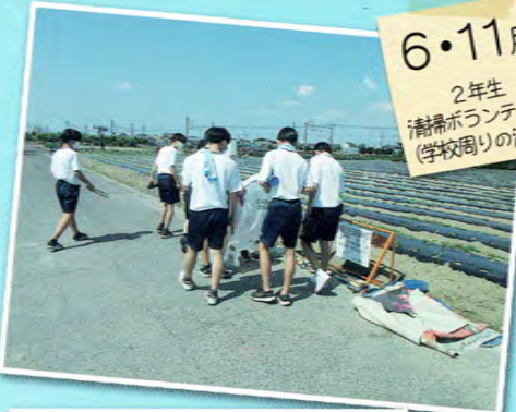
6・11月 2年生 清掃ボランティア (学校周りの清掃)