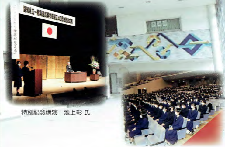
特別記念講演 池上彰氏