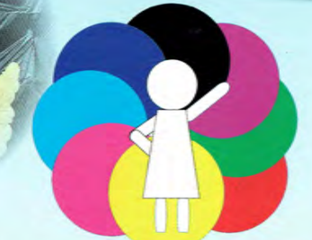
39回生 情報授業ビクトグラム作品「群団カラー」