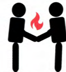
39回生 情報授業 ピクトグラム作品“活力②”