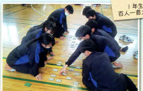
3月 1年生 百人一首大会