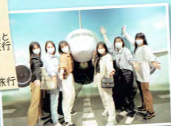
4月 3年生 コロナで延期と なった修学旅行 10月 2年生修学旅行