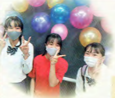
1月 3年生 大学入学共通テスト 壮行会