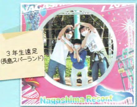
3年生遠足 (長島スパランド)