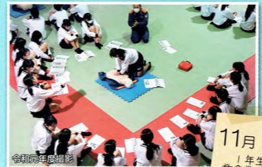
11月 1年生 救急救命法 (AEDの使い方)