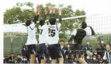
校技バレーボール大会