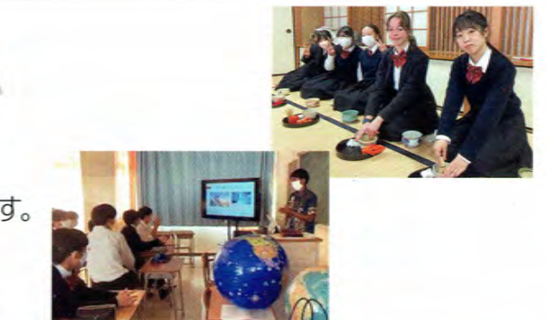
●国際交流イベント Crosscultural Event