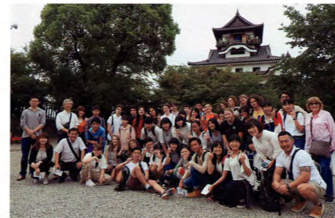
●エルウッド校短期派遣受入 The Sister School Visit by Elwood College