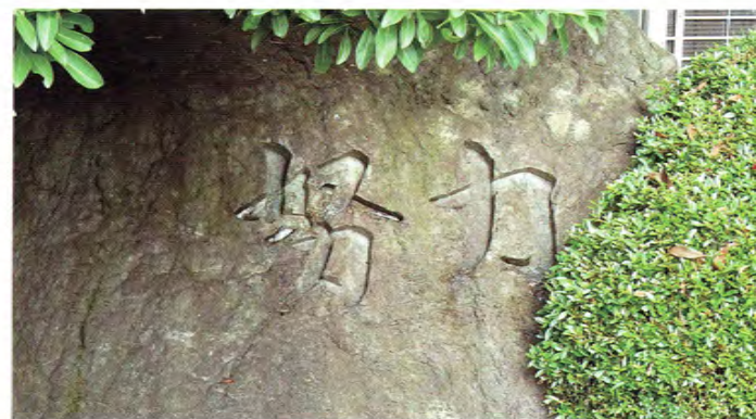
●校訓碑 / School Motto Monument