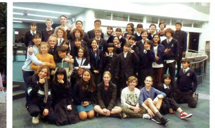
●エルウッド校短期派遣 The Sister School Exchange Program