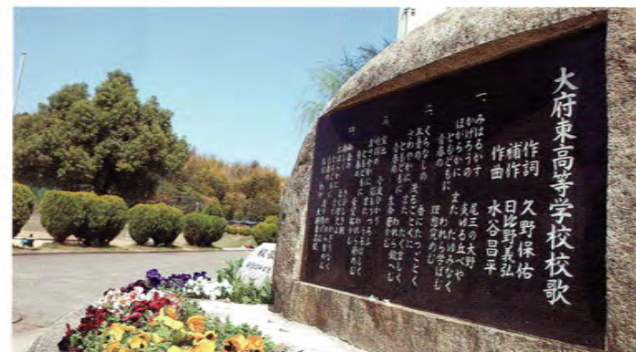
●校歌碑 / School Song Monument