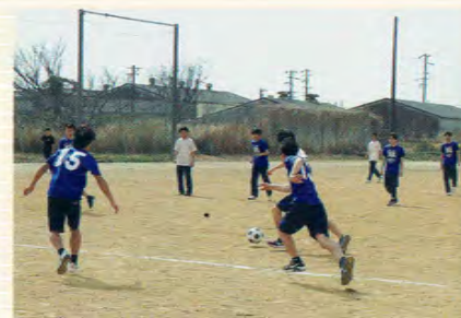
大東杯争奪春季球技大会