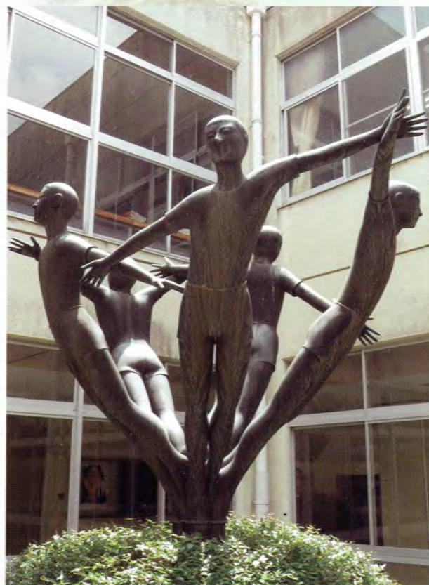
●希望の樹 / Monument of "Tree of Hope"